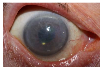
через 1 мес. после лечения