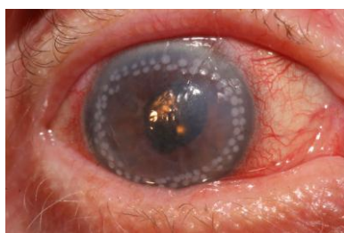
после 1-го сеанса